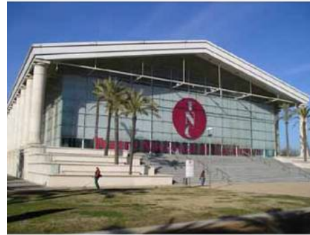
T. NACIONAL DE CATALUNYA