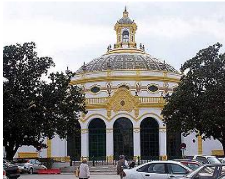
T. LOPE DE VEGA