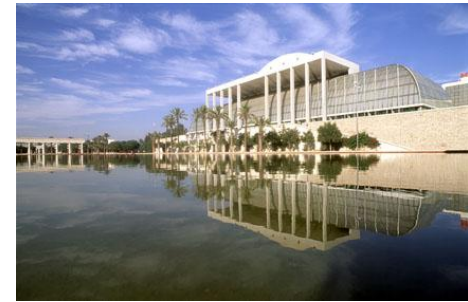
T. PALAU DE LA MÚSICA